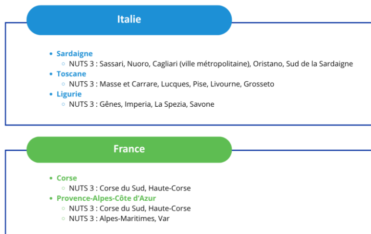
Figura 2 - Zone de coopération éligible à l'appel

Le respect de ces critères doit être attesté par des déclarations signées par le représentant légal (ou son mandataire dûment habilité), conformément aux modèles fournis en annexes 11 ainsi qu'à l'envoi de pièces justificatives.