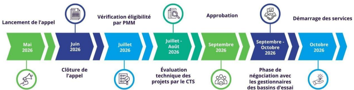
Figure 3 - Calendrier de l'appel

Il convient de noter qu'en cas d'égalité de score, la priorité sera accordée aux propositions ayant obtenu le score le plus élevé pour le critère « Qualité scientifique et technologique » (voir section 10).