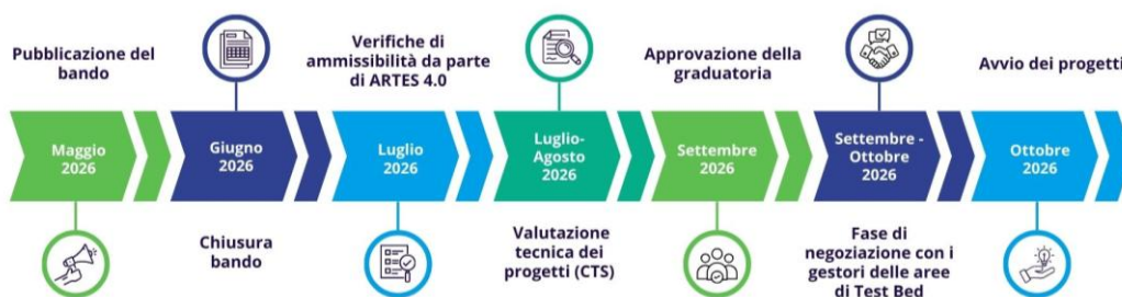
Figura 3 Timeline

La fase di negoziazione si conclude con la validazione definitiva del progetto, che costituisce il riferimento per l'avvio delle attività sperimentali.