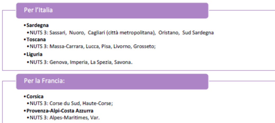
Figura 1 Area di cooperazione del Programma costituita dai territori NUTS3 che partecipano al Programma

I beneficiari avranno l'opportunità di testare e validare le proprie soluzioni direttamente sul campo, avvalendosi delle infrastrutture nei Test Bed messe a disposizione dal partenariato (Allegato 7).